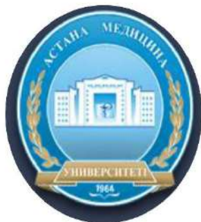
Медицинский университет Астаны (МУА)